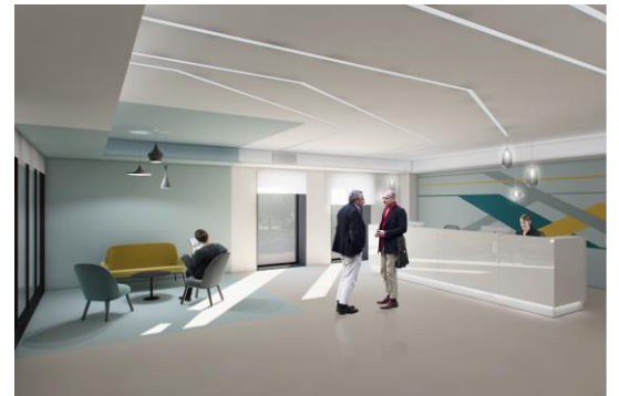
Figura 2 - Concept preliminare reception