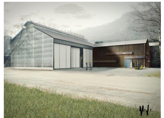
Figura 3 - Proposta per recupero fabbricato industriale