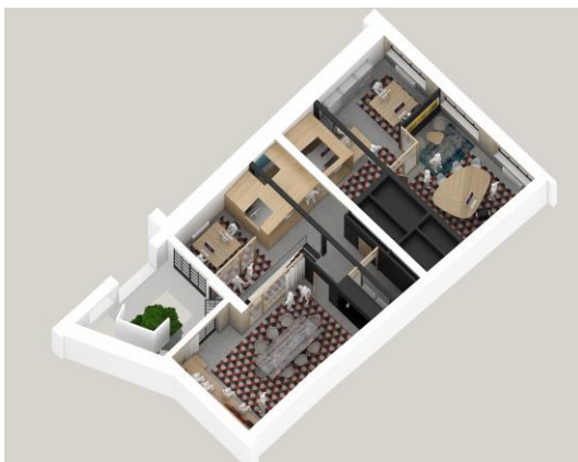
Figura 5 – Render di interni uffici