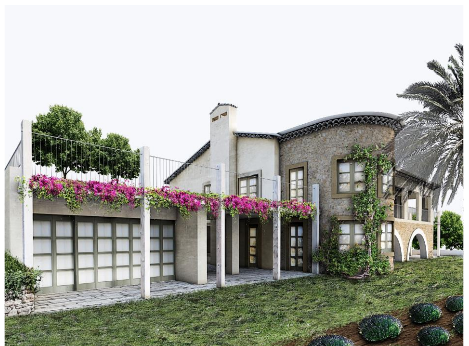
Figura 6 - Recupero di casa provenzale