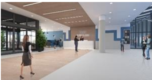
Figura 4 - Restyling hall palazzo uffici